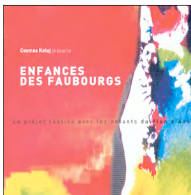
Pochette du DVD Enfances des Faubourgs

À travers un apprentissage technique mené dans le cadre d'ateliers vidéo et radiophonique, les enfants ont répondu à Znorko. Cela me paraît être une expérience importante parce que c'est, pour nous, un des moyens que nous avons trouvé pour partager un projet de création artistique avec les habitants de notre quartier.