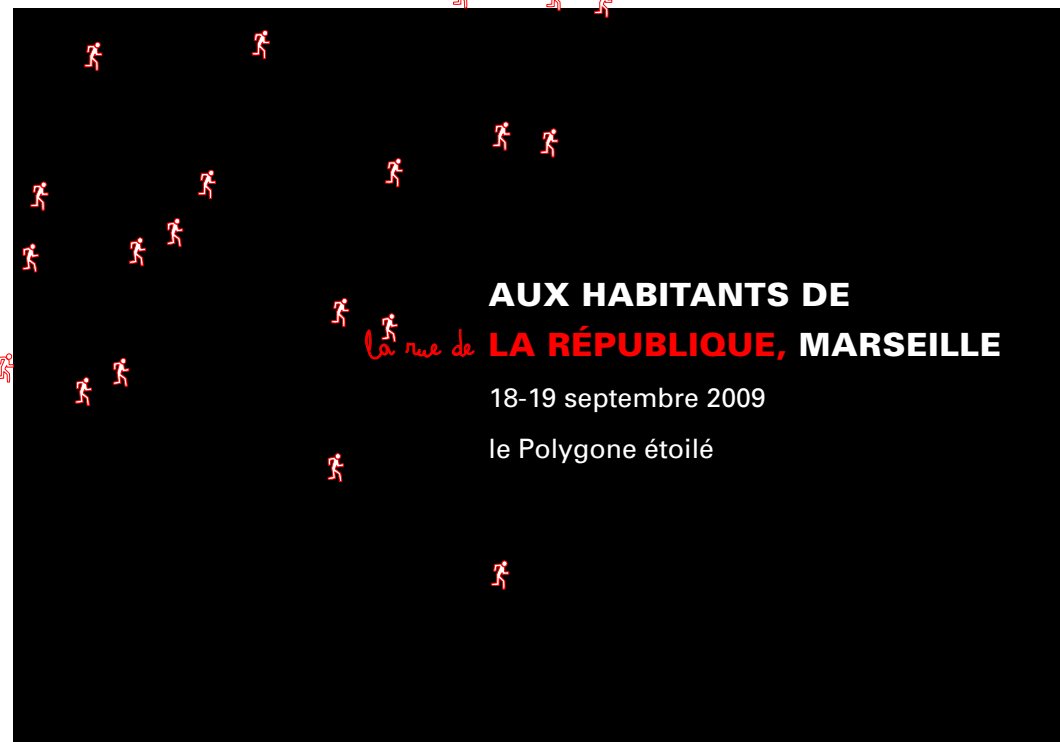
Mise en page : Martine Derain, image : Sygird Palis, 2004